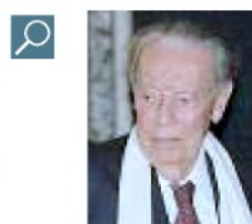
RONDI È il critico presidente del Festival di Roma

Il ministro: “Eliminiamo il concorso”. La sesta edizione al via il 27 ottobre